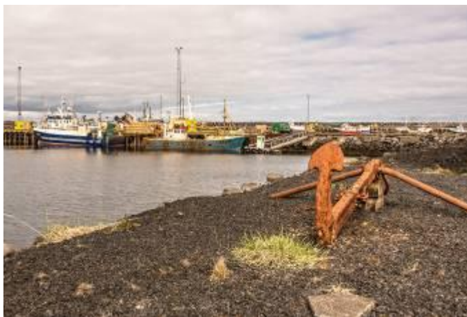
Sandgerdi, Iceland

V srpnu 2016 napsala absolventka Lenka z Islandu: Sandgerdi je malé město, na letišti je to co by kamenem dohodil a chybí typické mraky turistů. Většina hostů v restauraci jsou ti, co mají cestu na letišti nebo z letišti. Pak se tady ukáže i pár Islandců, kterým se nechce mluvit anglicky, protože jsou unavení z toho neskutečného množství turistů, takže občas jsou to nervy se s nimi domluvit. Od září budu chodit na hodiny islandštiny v Keflavíku, na které se těším. Ze začátku to bude asi boj, ale je to výzva.